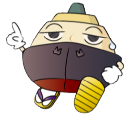
ふね検キャラクター テツオ

対象： ふね検受験者で乗船会参加を希望される方 募集人数： 10組程度 1組5名様まで乗船できます。5名より多い場合はご連絡ください。